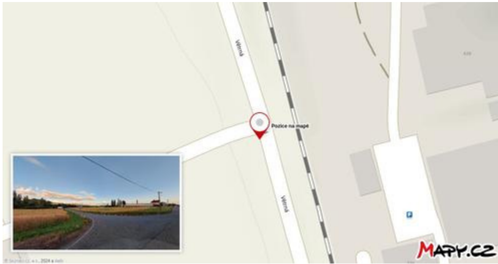
Obrázek č.5 Skutečná poloha